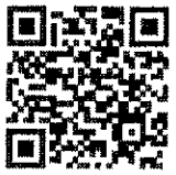
แบบรับฟังความคิดเห็น

สำนักงานส่งเสริมการปกครองท้องถิ่นจังหวัดนครศรีธรรมราช กลุ่มงานบริการสาธารณะท้องถิ่นและประสานงานท้องถิ่นอำเภอ โทร. ๐ - ๗๕๓๕ - ๖๑๔๔ ต่อ ๓๑